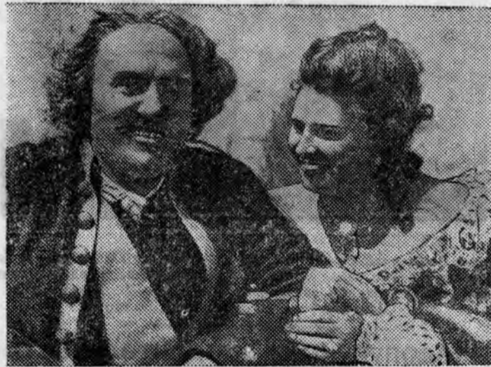
На снимке: Кадр из фильма «Петр I-й» (2-я серия). Народная артистка республики, орденосеица А. К. Тарасова в роли Екатерины и заслуженный артист республики орденосеица Н. К. Симонов в роли Петра I.

Из красноармейской газеты Дальневосточного Краснознаменного фронта «Тревога» (№ 191, 18 августа 1938 г.).